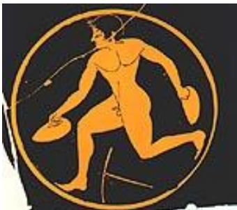
Рис. 2. Изображение длинный бег – «долиос», до 24 стадий (примерно 4,7 прыгуна в длину на км). На финише устанавливались каменные столбики, глиняной вазе которых необходимо было коснуться рукой. Стартовыми колодками служили каменные или мраморные упоры.

Начиная с 724 г. до н.э. в программу игр был включен бег на две стадии – «диаулос» (384,54 м), когда атлет пробегал дорожку стадиона в одну сторону, а потом в обратную (принцип челнока, бегуны касались столбика рукой и отправлялись в обратный путь, за фальстарт и иные прегрешения пороли розгами).