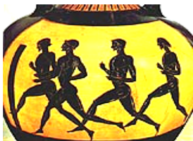
Рис. 1. Греческая ваза V века до н.э. с изображением бегунов

За несколько веков до нашей эры народы Азии и Африки устраивали состязания в беге, прыжках, метаниях, но особенно широкое распространение это получило в Древней Греции. Здесь были созданы специальные школы-гимназии, в которых юноши занимались физическими упражнениями, развивали силу, быстроту, ловкость, выносливость.